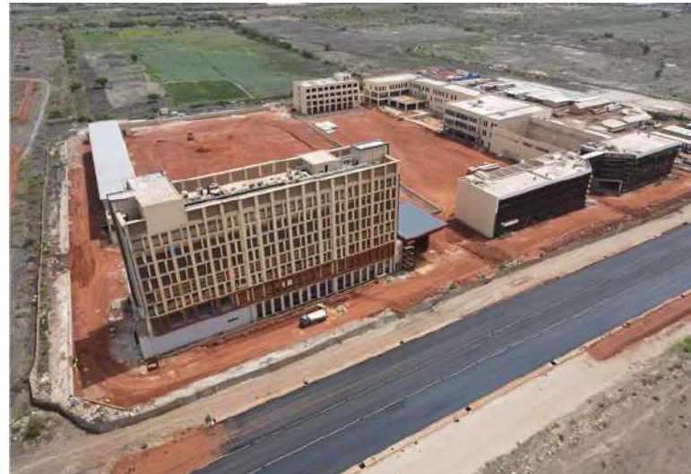
Image Des Travaux