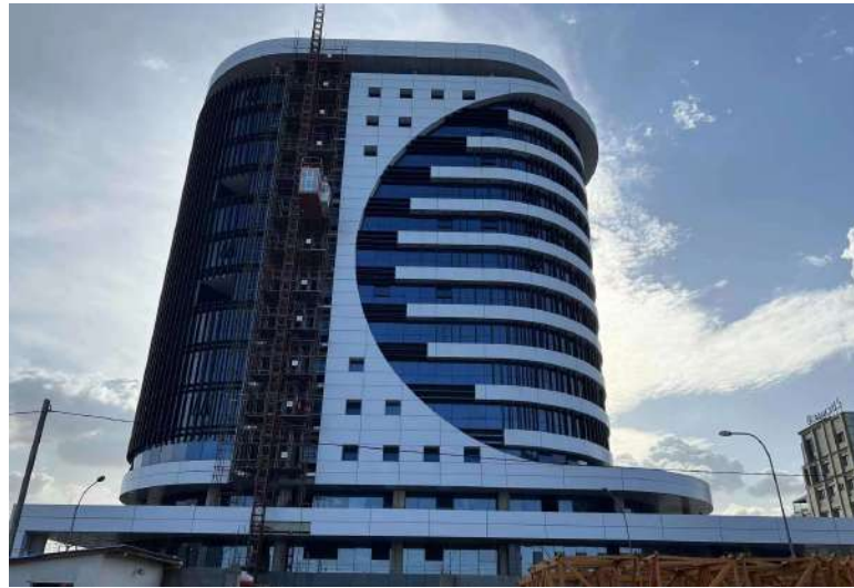
Image Des Travaux